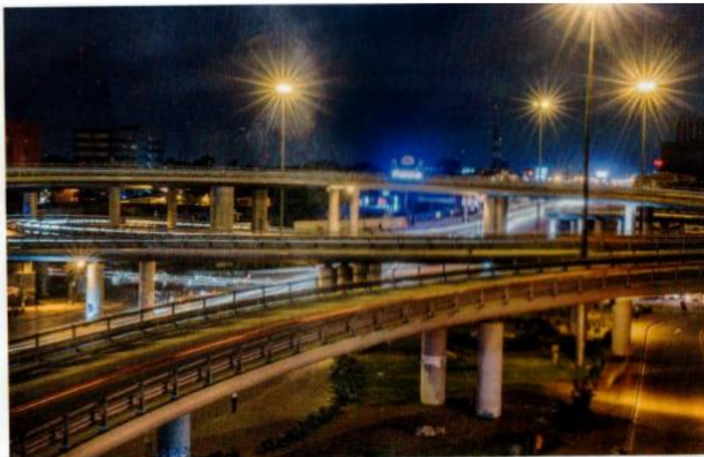
2013 年奠基，阿比让 Henri-Konan-Bédié 立交桥是非洲最现代化设施之一。