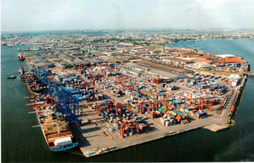
正在建设中的阿比让港集装箱码头。建成后，该港集装箱年吞吐量将由原来的 80 万标箱增加到 200 多万标箱。