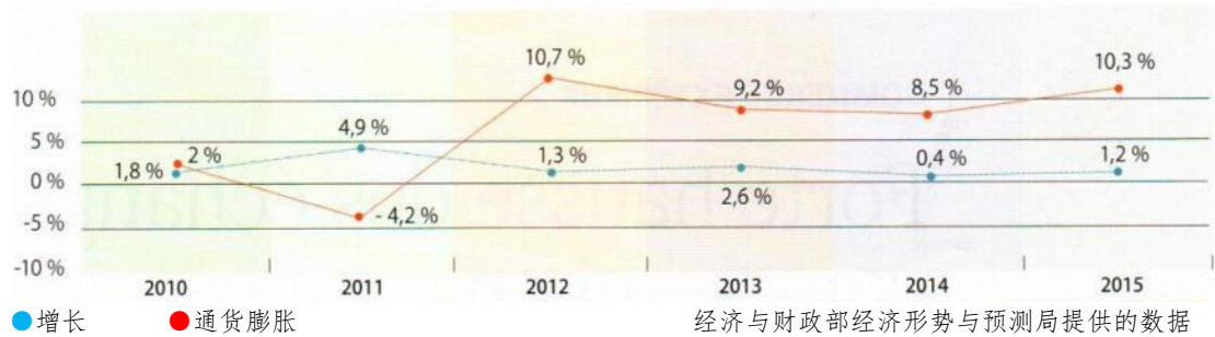
实际 GDP 和通胀率的变化